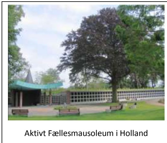
Aktivt Fællesmausoleum i Holland

I denne førstnævnte lyse og strålende fremtidsverden, hvorfra man således kan se ned på vore dages primitivitet og ufuldkommenhed, vil ethvert afsjælet menneskelegeme blive bisat under en for det virkelige menneske standsmæssig form, hvilket vil sige i kontakt med naturens love og på en for mikroindividerne i legemet og for det samme legemes tidligere jeg eller ånd harmonisk og lykkelig måde.